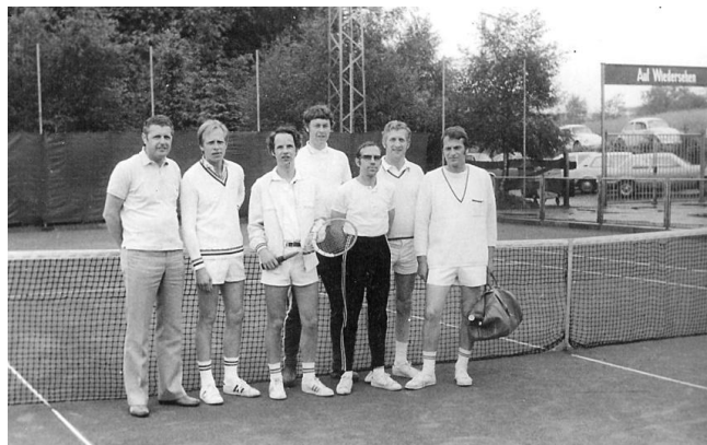
3 Jahre TC Jesteburg und im Juni 1973 Aufstieg von der Kreisklasse in die Bezirksklasse

Bereits 1973 ließ der Club eine Flutlichtanlage für die Plätze 1 und 2 bauen, womit die tägliche Spielzeit erheblich verlängert werden konnte. Es gab noch keine Sommerzeit! Nach dreijährigem Bestehen des Spielbetriebs wurde die 1. Medemannschaft des TC Jesteburg Meister in der Tennis-Kreisklasse Gruppe 2 und stieg in die Bezirksklasse auf. Nur drei Spieler hatten langjährige Tennispraxis und der Rest spielte erst seit der Vereinsgründung Tennis. Auf der Mitgliederversammlung am 23.10.1973 wurde der Vorstand auf sieben Posten erweitert. Ein Jugendwart und ein verantwortlicher Vorsitzender des Festausschusses kamen dazu. Diese Aufgabenteilung des Vorstands besteht noch heute.