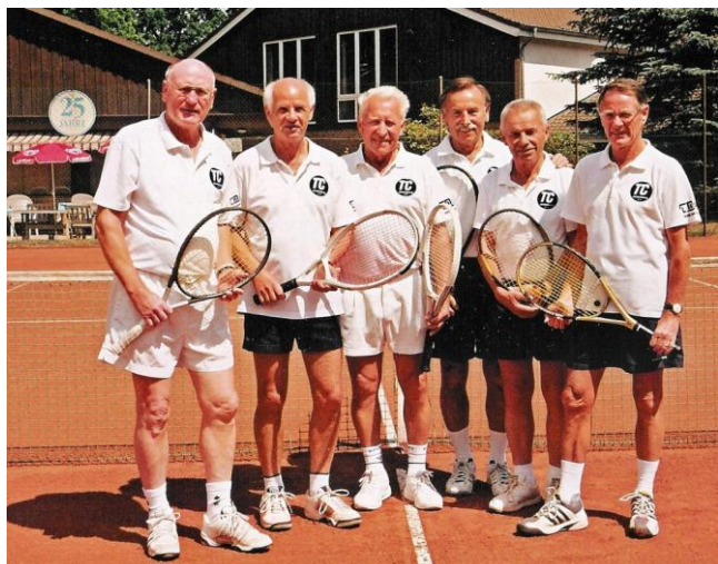
2008 - Tennissenoren AK 70 sind Niedersachsenmeister und Norddeutscher Vizemeister