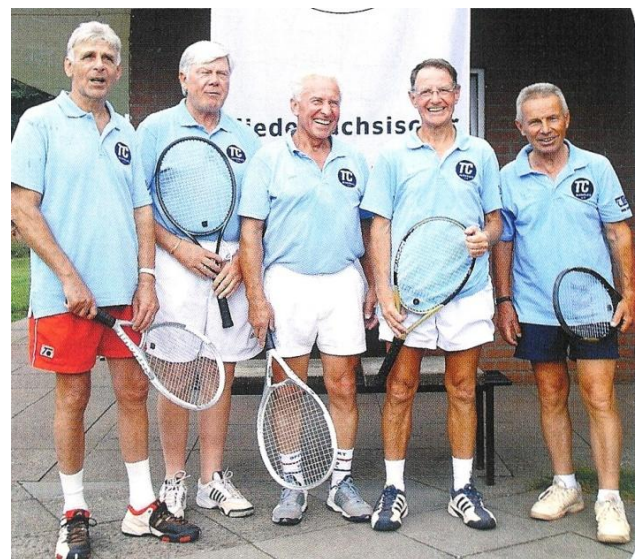
2007 - TC Jesteburg Herren 70 ist Norddeutscher Mannschaftsmeister

Die Mannschaft der Herren 70 hatte im Sommer 2007 die Norddeutschen Mannschaftsmeisterschaften gewonnen und wurde Vierte bei den Deutschen Mannschaftsmeisterschaften.