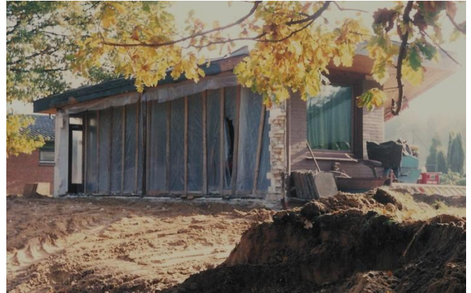
1983 Restbau nach Abriss der Container und Teilen des Clubhauses

zügigen Dusch- und Umkleieräumen, Toiletten für Damen und Herren sowie der Küche mit angrenzendem Vorratsraum. Später kam noch der Technikraum dazu. Der Club hatte nun ca. 350 Mitglieder.