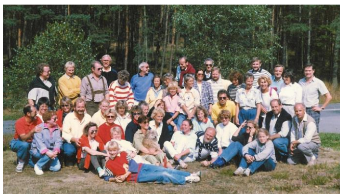
1986 - Fahrradausflug der Tennisabteilung mit Ziel Büsenbachtal