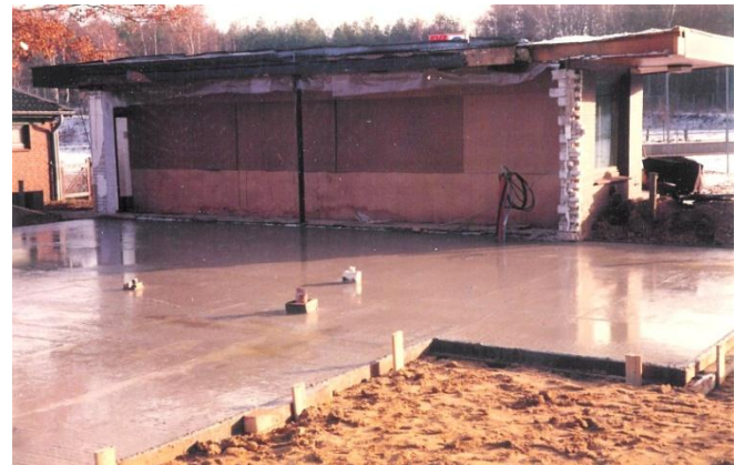
1983 Clubhaus - Sohle gegossen für Erweiterungsbau