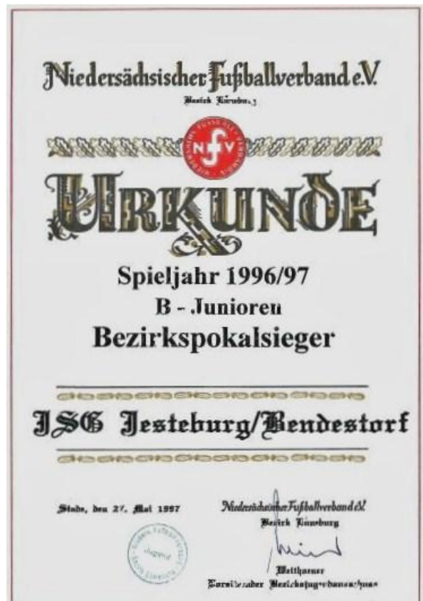
1997 B-Junioren sind Bezirkspokalsieger